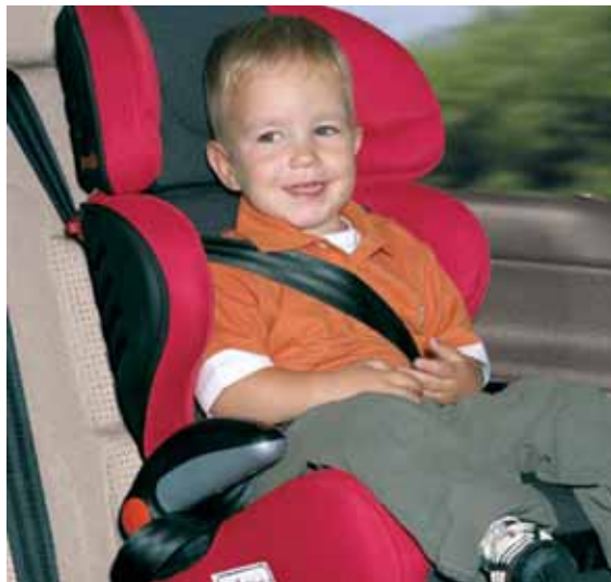
◀ La Fundación estudia los hábitos de uso de los sistemas de retención infantil.