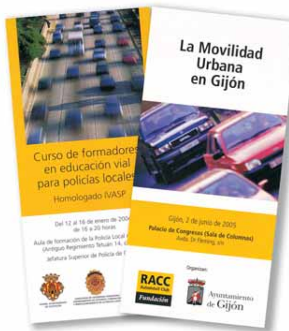
◀ La Fundación se preocupa de la relación entre movilidad y entorno.

■ La difusión de la movilidad sostenible ha sido también el eje argumental de la participación de la Fundación en seminarios y cursos como Movilidad urbana sostenible (Ordenación del territorio y planificación urbana) que tuvo lugar en Sevilla en junio de 2005, o Medio ambiente, patrimonio y expresión gráfica: capacitación profesional en la sostenibilidad , de la Universidad de Granada, en octubre de 2005. Además la Fundación ha organizado la Jornada sobre transporte y movilidad sostenible , junto con el Instituto Mediterráneo para el Desarrollo Sostenible, en Valencia, en junio de 2004, el Seminario sobre movilidad urbana y eficiencia energética junto con la Agencia Local de la Energía del Ayuntamiento de Sevilla, en septiembre de 2004, la Jornada sobre movilidad sostenible en Girona, conjuntamente con la Universidad de Girona, en diciembre de 2004, y el Segundo Foro RACC Madrid , dedicado al tema Obras y medio ambiente en noviembre de 2005.