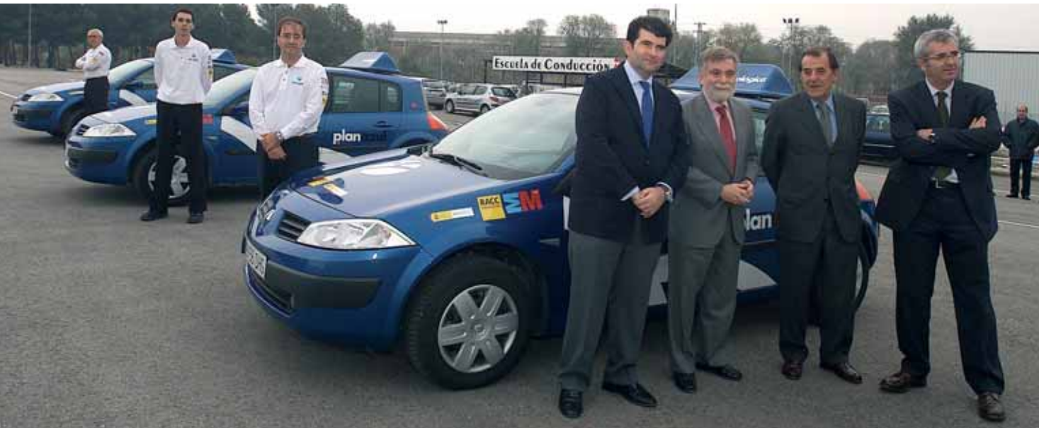
▲ Presentación de los cursos de Conducción Ecológica del Plan Azul de Madrid.

■ A partir del análisis de estos cuatro ejes, la Fundación considera que es necesario el compromiso de todos los agentes implicados en el ámbito de la movilidad para conseguir un nivel de consumo que no hipoteque los recursos naturales del futuro. La Fundación entiende que las administraciones deben actuar e impulsar una revisión de la fiscalidad del automóvil y la mejora del transporte público, al igual que los fabricantes de vehículos, que tienen que seguir trabajando en el desarrollo de tecnologías ecológicamente eficientes.