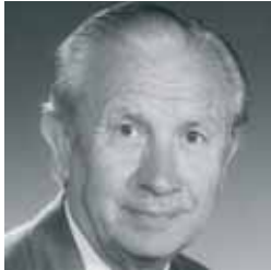
Juan Antonio Samaranch Presidente de Honor