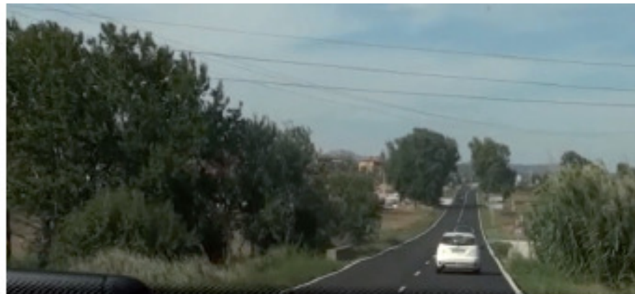
Tram sense voral

- Determinades carreteres (C-17, N-340, C-14, C-13) presenten multiplicitat d'accessos , quasi tots no ordenats, que augmenten de forma notable el risc d'accident i les seves conseqüències si la velocitat de circulació és elevada.