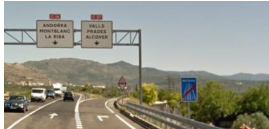
Senyalització de canvi de tipus de via no reforçat amb una limitació de velocitat.