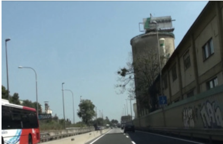
Tram sense vorals