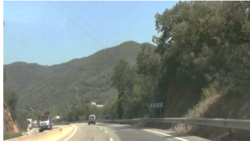
Corba amb panells indicatius sense senyalització de velocitat màxima