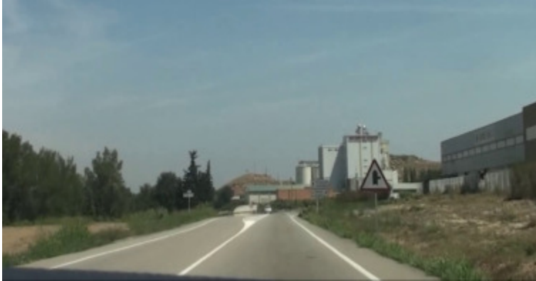
Amplada de vorals estrets