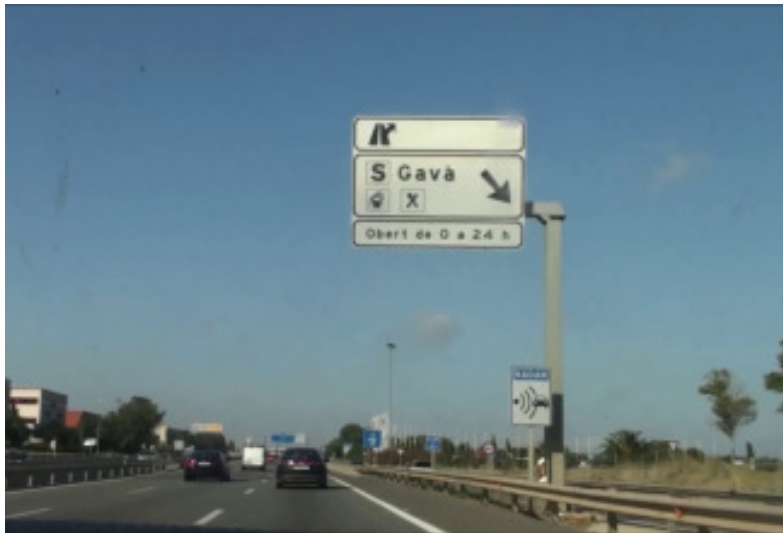
Radar sense senyal de velocitat màxima