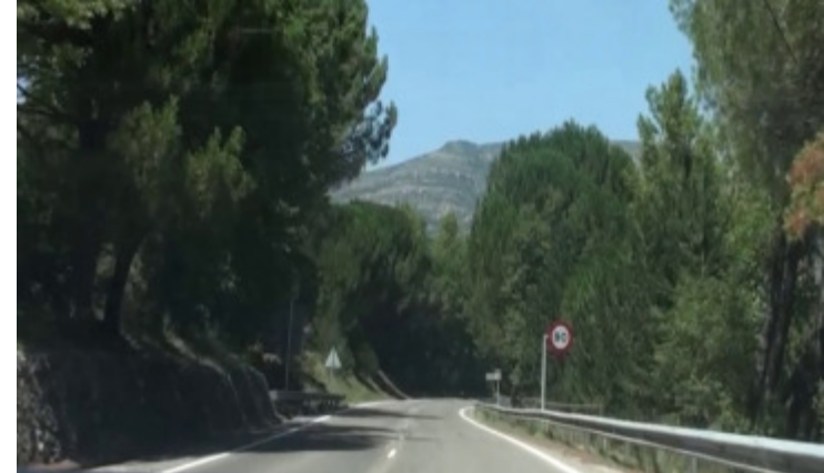
Tram en corba amb una limitació de 90 km/hora