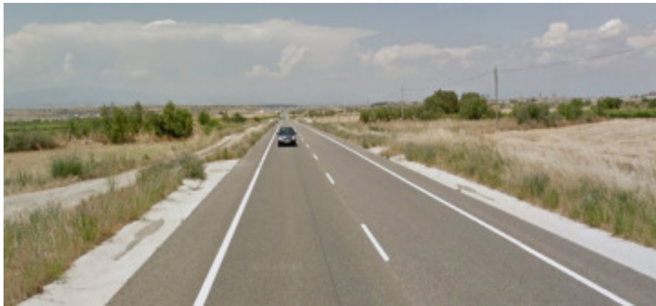
Accessos sense carril d'acceleració.