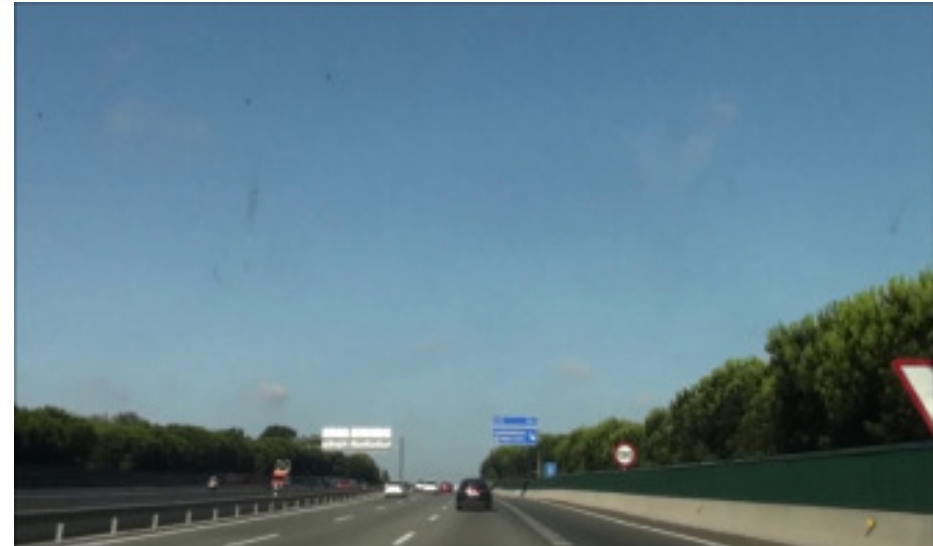
Senyal de velocitat màxima sense duplicar