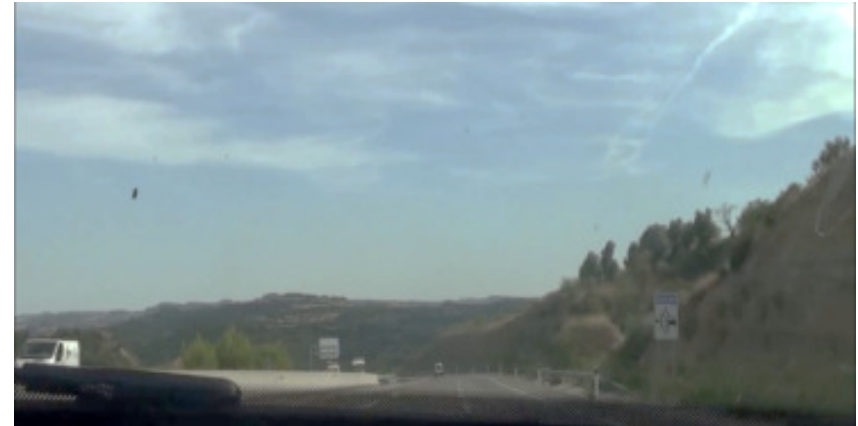
Senyal de radar sense recordatori del límit de velocitat