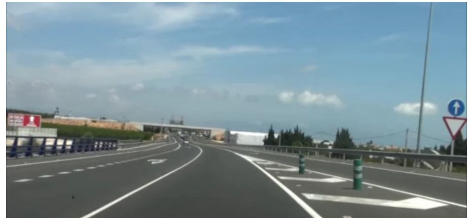
Tram amb carrils d'acceleració adequats (nova variant L'Aldea)