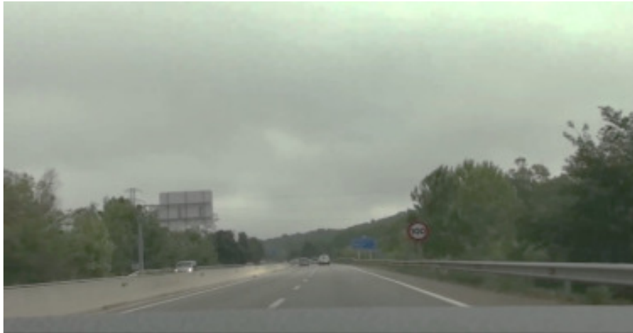
Manca de duplicació de la senyalització.