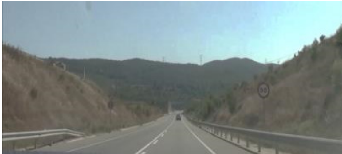
Morfologia tipus de la via