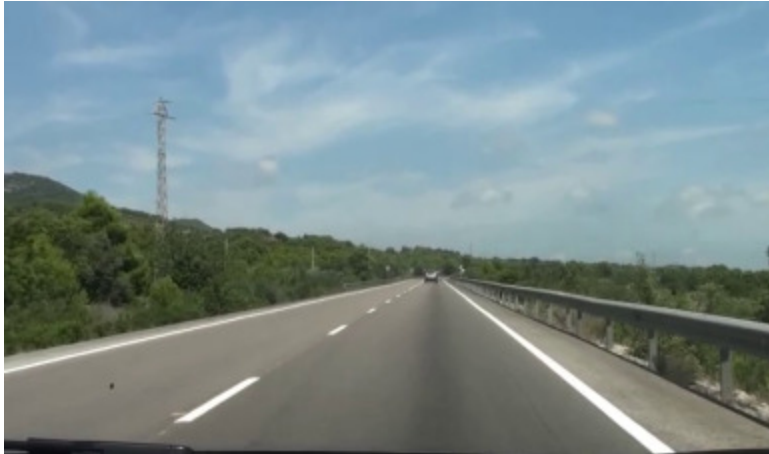
Amplada de vorals reduïts (Alcanar)