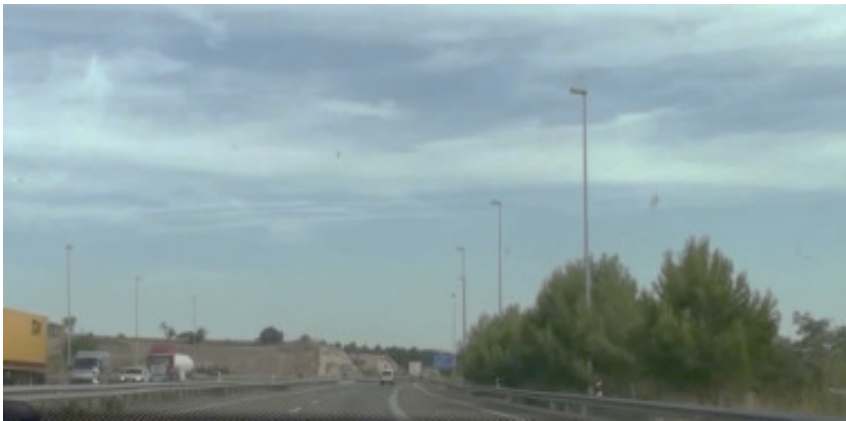
Incorporació sense senyalitzar el límit de velocitat de la via