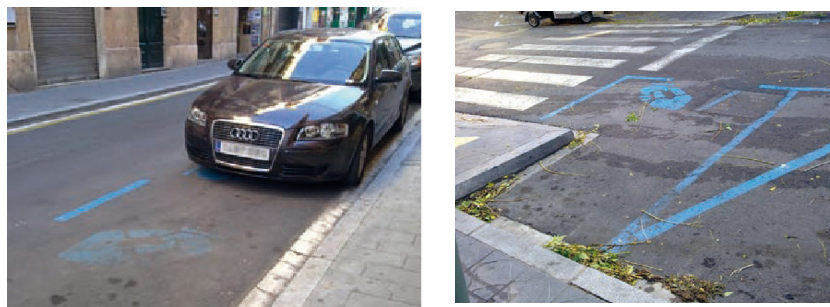
Exemple nivell de servei als conductors